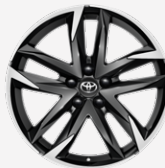
GR-S 19" sort poleret alufælg (5-dobbelt-eget)