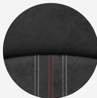
GR-S sædebetræk i sort Alcantara®/læder med sølv og røde syninger